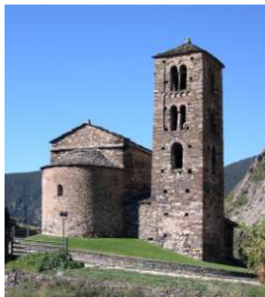
Sant Joan de Caselles (Canillo)