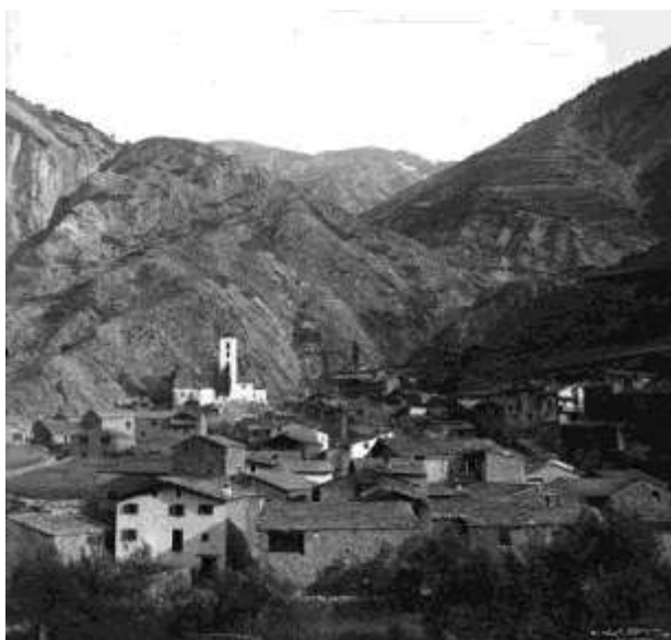
Una imatge de Canillo, l'any 1882